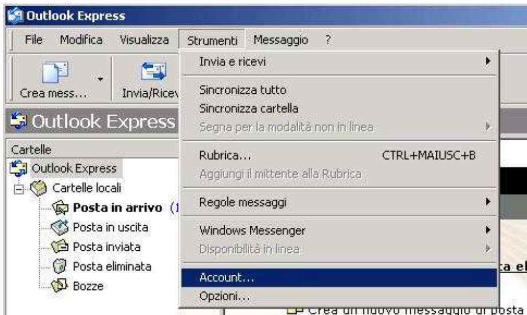
Figura 1: main