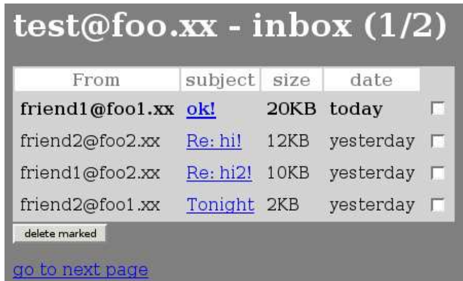
Figura 7: inbox

<input type="hidden" name="session_id" value="ABCD1234"> <table> <tr><th>From</th><th>subject</th><th>size</th><th>date</th></tr> <tr> <td><b>friend1@foo1.xx</b></td> <td><b><a href="/read.php?session_id=ABCD1234&uidl=123">ok!</a></b></td> <td><b>20KB</b></td> <td><b>today</b></td> <td><input type="checkbox" name="check_123"></td> </tr> <tr> <td>friend2@foo2.xx</td> <td><a href="/read.php?session_id=ABCD1234&uidl=124">Re: hi!</a></td> <td>12KB</td> <td>yesterday</td> <td><input type="checkbox" name="check_124"></td> </tr> </table> <input type="submit" value="delete marked"> </form> <a href="/inbox.php?session_id=ABCD1234&page=2">go to next page</a> </body>