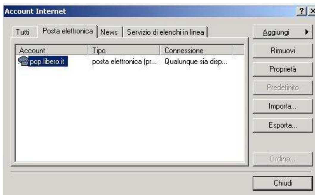
Figura 2: settings