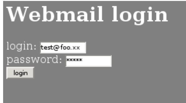
Figura 5: login

pagina di login della webmail vista con Mozilla e il codice sorgente della stessa pagina (con Mozilla lo si vede con Ctrl-U, figura 5).